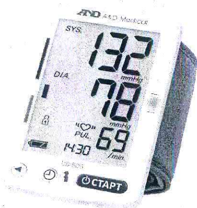
Рисунок 5 – Модель UB-505

Пломбирование приборов для измерения артериального давления и частоты пульса цифровых серии UB, моделей: UB-201, UB-202, UB-402, UB-403, UB-505 не предусмотрено.