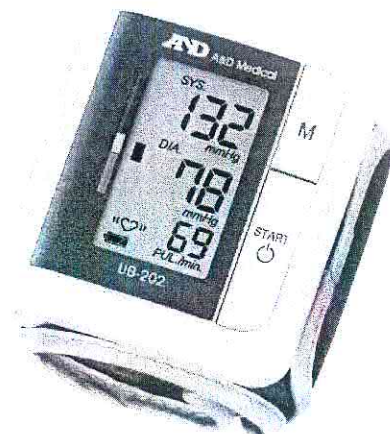
Рисунок 2 – Модель UB-202