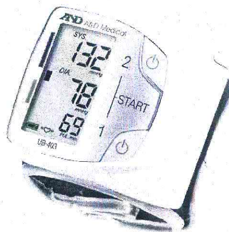
Рисунок 4 – Модель UB-403