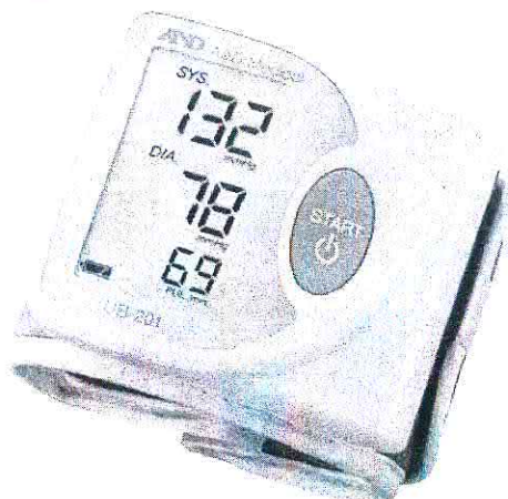
Рисунок 1 – Модель UB-201

Общий вид приборов для измерения артериального давления и частоты пульса цифровых серии UB, моделей: UB-201, UB-202, UB-402, UB-403, UB-505 представлен на рисунках 1 – 5.