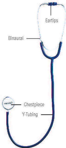
ДКМСИТФ Й жПШИМ