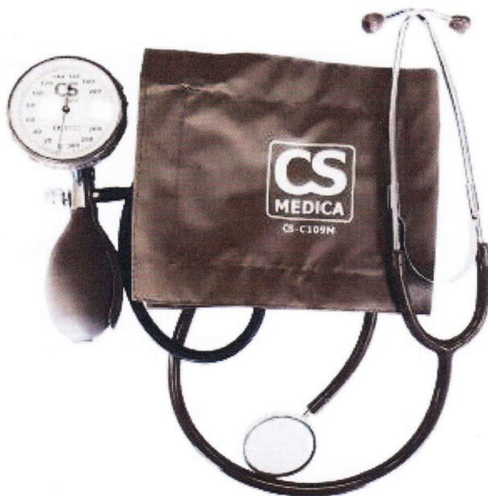
Рисунок 1 – Измеритель артериального давления CS Medica CS-109 Premium

Общий вид измерителя артериального давления CS Medica CS-109 Premium представлен на рисунке 1.