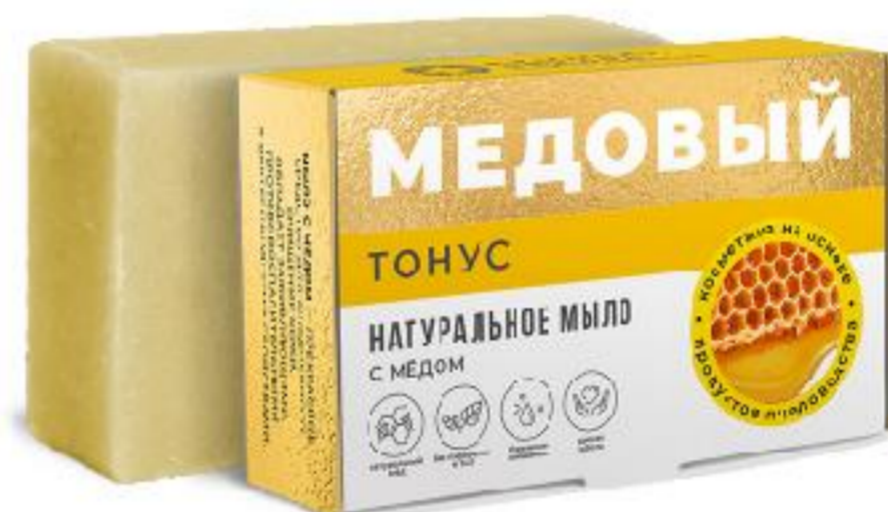
Тонус с мёдом