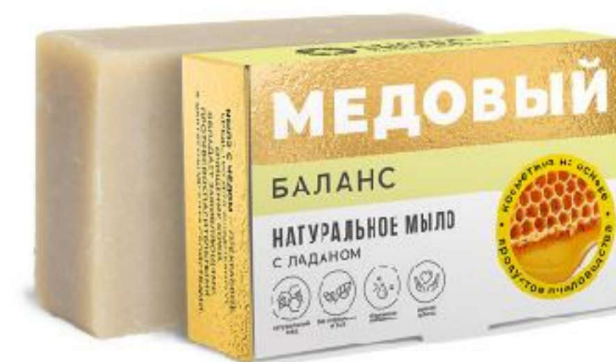
Баланс с ладаном