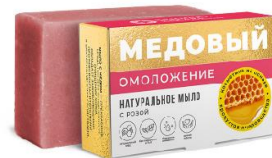
Омоложение с розой