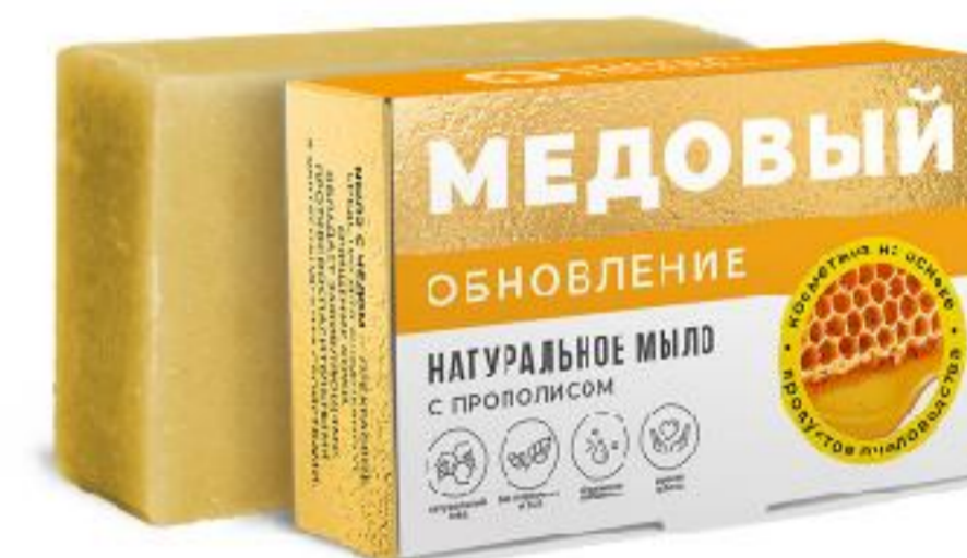
Обновление с прополисом