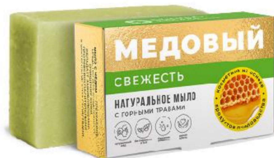
Свежесть с горными травами