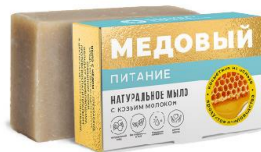
Питание с козьим молоком