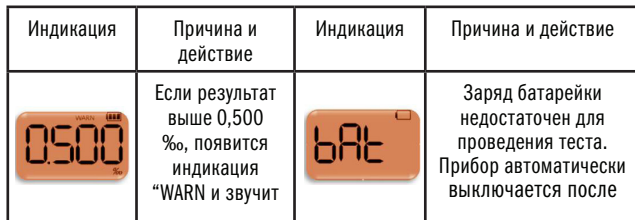
Таблица неисправностей и предупреждений