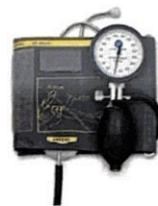
Рисунок 9. Общий вид LD-81