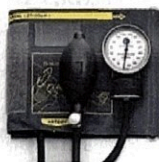
Рисунок 3. Общий вид LD-70