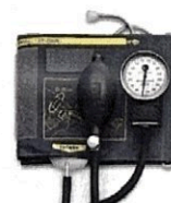
Рисунок 5. Общий вид LD-71