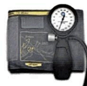
Рисунок 10. Общий вид LD-90