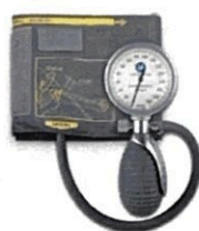
Рисунок 8. Общий вид LD-80Silver