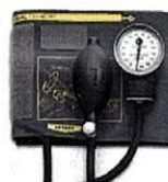
Рисунок 4. Общий вид LD-70NR