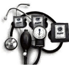
Рисунок 7. Общий вид LD-80