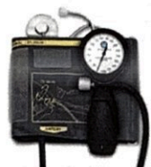
Рисунок 11. Общий вид LD-91