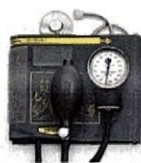
Рисунок 2. Общий вид LD-61