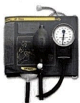
Рисунок 6. Общий вид LD-71A