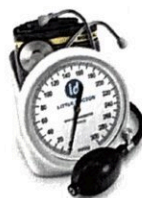
Рисунок 12. Общий вид LD-100