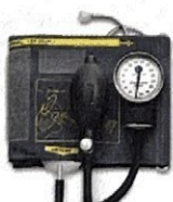
Рисунок 1. Общий вид LD-60

Фотографии общего вида средств измерений приведены на рисунках 1 – 12.