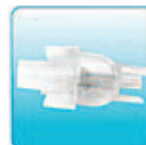
Емкость для лекарства – 1 шт.