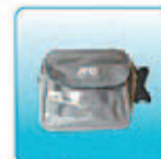
Кейс для хранения и переноски – 1 шт.