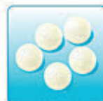
Воздушный фильтр – 1 шт.