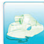
Респираторная маска для взрослых – 1 шт.