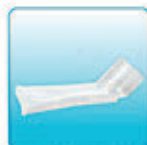
Насадка для рта – 1 шт.