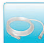
Соединительная трубка – 1 шт.