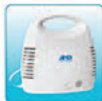
Основной блок в корпусе – 1 шт.