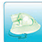
Респираторная маска для детей – 1 шт.