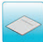
Руководство по эксплуатации (на русском языке) и гарантийная карта – 1 шт.